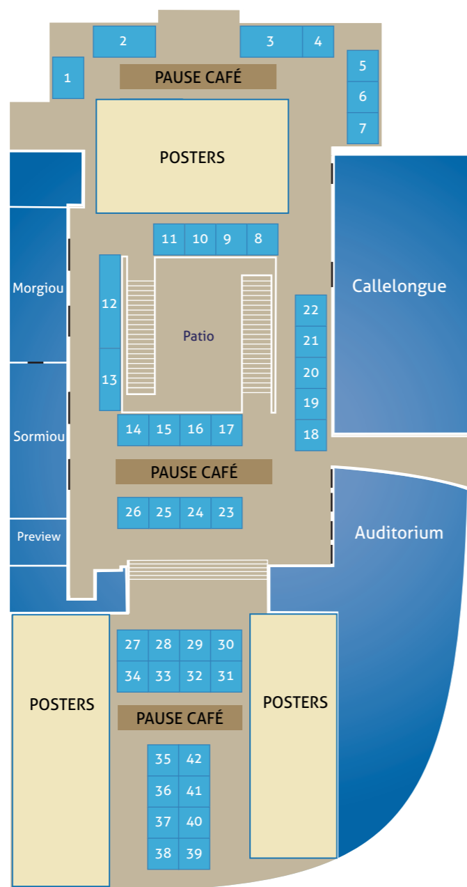
Plan provisoire en date du 1er juillet 2018