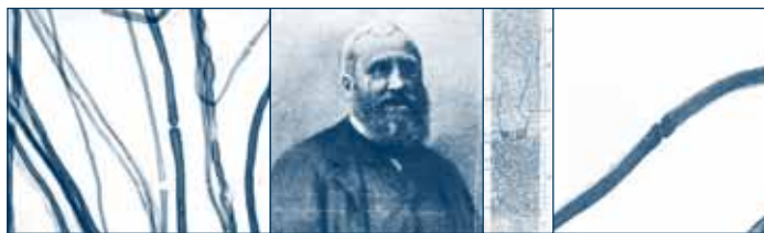
Fibres nerveuses marquées à l'Osmium Louis Ranvier (1835-1922)

Si les étranglements des gaines de myéline ne portaient pas son nom, Louis Ranvier, disciple de Claude Bernard, professeur au Collège de France, et surtout histologiste de passion au service de la physiologie, ne susciterait chez la majorité d'entre nous plus aucun souvenir. En parcourant cette carrière, du laboratoire privé de la rue Christine à Paris à la chaire du Collège, la description en 1871 des constrictions annulaires des fibres nerveuses n'est plus seulement un détail anatomique, mais une observation capitale pour servir un programme histologique tourné vers la physiologie bernardienne. L'anatomie microscopique engendre chez Ranvier l'histophysiologiste, une approche dont relèvent encore les recherches actuelles sur les nœuds de Ranvier et la conduction saltatoire.